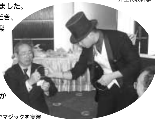
各テーブルでマジックを実演

また今回、「歳末ふれあい募金」に対して、多数の方のご支援をいただき、合計3万5,326円の募金が集まりました。なお、お預かりした募金は、障害者のためのスポーツ大会の運営や、児童養護施設の子ども達への支援、高齢者福祉の向上、奨学金の充実などの目的のため用いられます。会員の皆様から多くの善意を賜り、ありがとうございました。