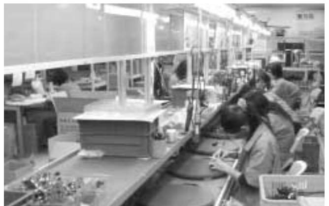
禾企電子会社・組立工場見学