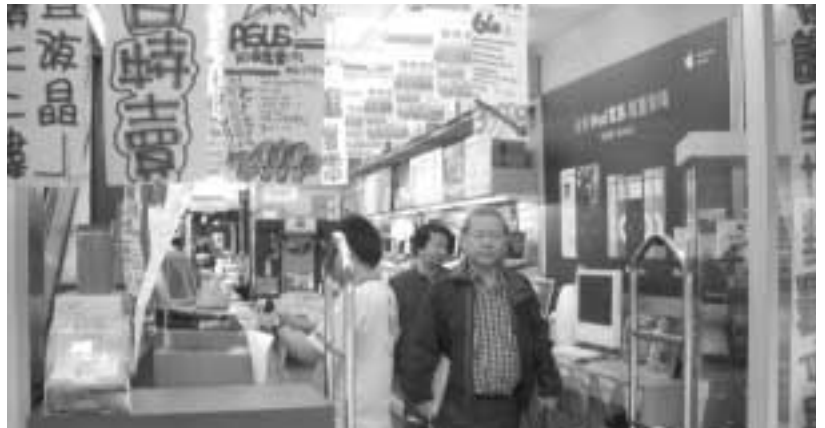
西門電影街を視察（右上と右下）