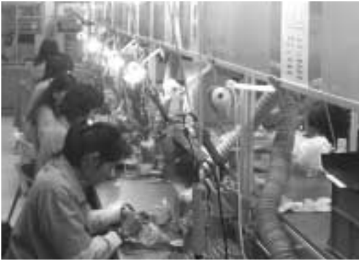
禾企電子会社・モジュールの生産工場にて

できる態勢を整えているのが、台湾メーカーの流儀でしょう。台湾メーカーも、中国メーカーの台頭には危機感を持っているということでした。