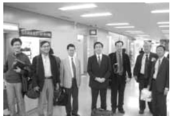
台湾桃園國際空港にて

KVBCとして、海外の企業を訪問し、感動と刺激、さまざまな異文化・風土を肌で感じるのには重要なことだと思います。当然ながら、実際に参加しなければこれは体験できません。最後になりましたが、有意義で楽しい旅を無事終えることができましたこと、参加者の皆さんに感謝いたします。