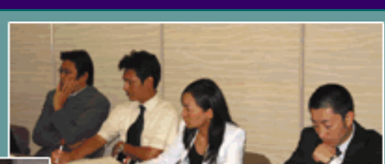
参加者の表情は真剣そのもの

去る9月15日、京都市健康保健組合保養所「きよみず」において、「The thirties KVBCメンバーズクラブ」が開催されました。第2回目となる今回の研修テーマは、「問題解決実践力を養成する（問題解決実践に強くなる）」。 KVBC会員企業から30代の幹部候補生14名の参加がありました。 講師の杉原潔氏（株）アポロ総合経営代表取締役から、問題解決の4原則（(1)事実を確認する、(2)問題を細分化する、(3)順番に実行していく、(4)広く深く考える）や、問題解決実践のための3つのアプローチ（(1)感情的アプローチ、(2)分析的アプローチ、(3)具体的即効的アプローチ）などについて説明が行われ、参加者同士のディスカッションを交えながら、諸問題を解決に導くさまざまなノウハウや技術について研修が進められました。