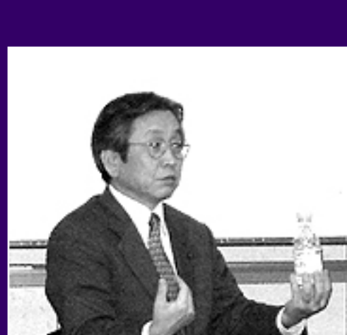
具体例を交えながら産学連携の現状を解説

大学をリサーチするときは、規模や知名度を基準にするのではなく、自分の会社のニーズに応じてくれる大学を選ぶ必要があります。規模は小さくても、非常に優れた知識やノウハウを持った研究者を抱えている大学もたくさんあります。ほとんどの大学が研究成果をまとめたシーズ集を用意しているほか、インターネットに研究内容や特色などを掲載しています。また、研究者のデータベースを一覧で掲載しているホームページもあります。まず、自分たちの目的にかなう大学をいくつか絞った上で、産学連携の窓口「こんなことを考えているんだけど」と電話なりメールを送っていただければ、必ず何らかのアクションが返ってくるはずです。企業の皆さんは、これまでさまざまな異業種交流や業界内の情報交換に取り組んでこられたと思います。大学を敷居の高い特別な存在ととらえずに、異業種の1つだと考えて気軽に足を運んでいただきたいと考えています。