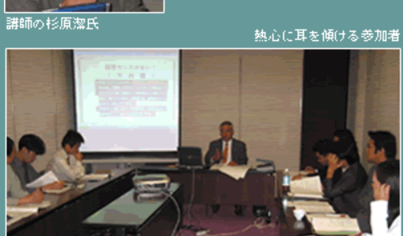
熱心に耳を傾ける参加者